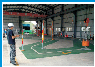
固定式起重機實習場地