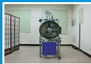
第一種壓力容器實習場地