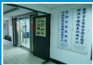
即測即評及發證試務中心