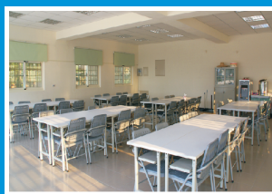
實習場地休息空間