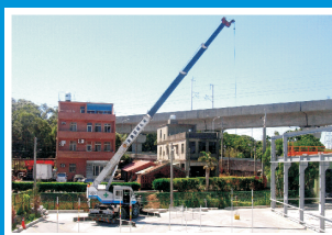
移動式起重機實習場地